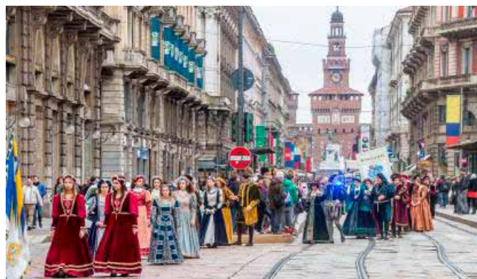
A Milano, all'Expo, l'anteprima con il corteo del matrimonio

La nuova edizione della Festa del Torrone sarà una celebrazione a 360 gradi del dolce più caratteristico della tradizione cremonese, fiore all'occhiello della pasticceria artigianale italiana nel mondo, a partire dalle sue radici storiche. E non a caso da Expo partirà, il 25 ottobre, il celebre corteo che rievoca il matrimonio tra Francesco Sforza e Bianca Maria Visconti, l'occasione che, secondo tradizione, proprio il 25 ottobre del 1441 diede vita al dolce ad opera di due pasticceri lombardi. Un corteo di oltre 150 figuranti sfilerà alle 10.30 lungo il Decumano all'Expo tra le acrobazie degli sbandieratori,